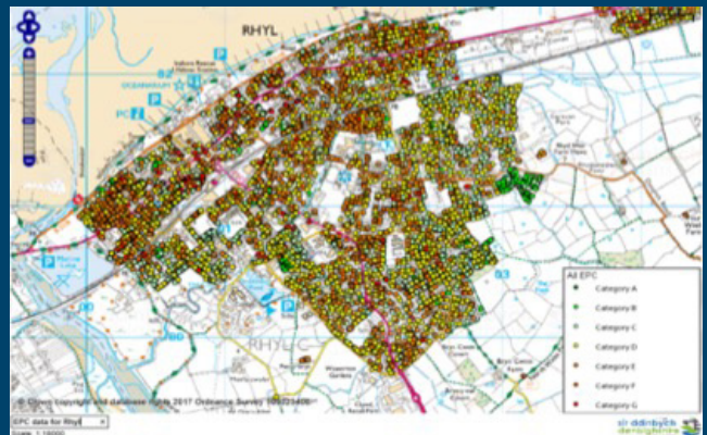
Mae data Tystysgrif Perfformiad Ynni wedi'i gysylltu'n awdurdodol, yn fanwl

Gyda'r rhestr awdurdodol honno, roedd Cyngor Sir Ddinbych yn gallu sicrhau cyllid gyda gwerth cyfalaf o tua £377,650 gan ddarparu'r Rhwymedigaeth Cwmni Ynni. Roedd hyn yn golygu y gallai amodau tai yr holl denantiaid hyn gael eu gwella am gost isel neu ddim cost o gwbl i'r landlordiaid.