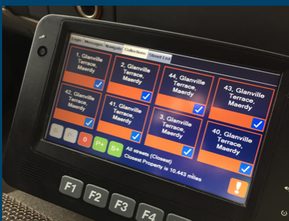
Dyfeisiadau InCab yn cysylltu ag UPRN

Mae'r dyfeisiadau hefyd yn bwydo gwybodaeth ar y pryd ar gynnydd a statws casgliadau, cyfraddau casgliadau, yr amser a gymerir a gwybodaeth am dipio yn ôl i'r depo.